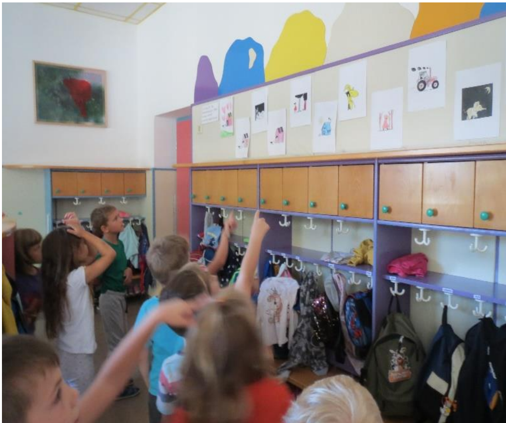
Predstavitev ilustracij otrokom iz sosednjih igralnic